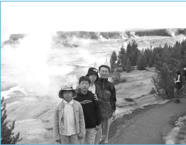
Yellowstone national park에서의 가족사진

지난 연수기간을 되돌아보니 빙그레 입가에 미소가 그려집니다. 아마 어렵고 서러운 일도 많았겠지만 그런 것은 잊어지고 좋은 기억만 남아서 이겠지요.